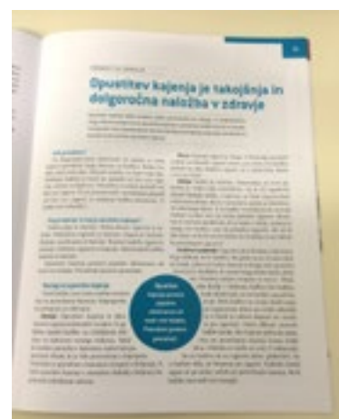
9. sz. fénykép A megjelentetett cikk (2. rész)