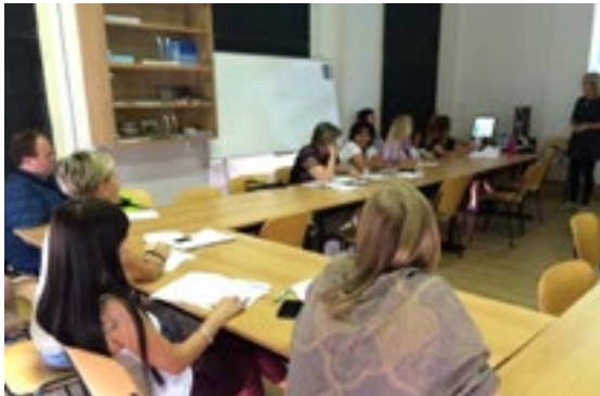
3. sz. fénykép A szakmai találkozón készült fényképek

A szóbeli poszter prezentációval kapcsolatosan az SRNT Europe konferencián elfogadásra került a „Szakmai találkozók oktatóinak modell jellegű képzése az ápolók dohányfüggőség esetén alkalmazott intervenciós készségének javítása céljával – kelet-európai modell” feliratú poszter.