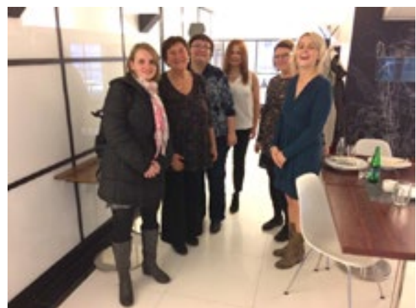
6. sz. fénykép Az SLZT néhány dolgozója és munkatársa (akik közül néhányan szintén előadtak a konferencián).

2016. november 9-én a Dohányfüggőség Gyógyító Társaság (SLZT) „Dohányzás és egészség” c. konferenciát tartott.