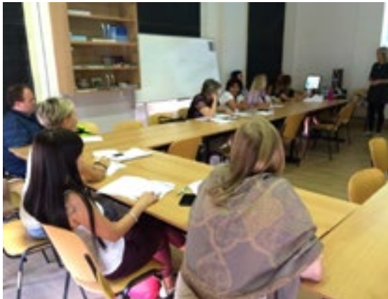
Fotografija št. 3: Fotografija z delavnice

Za ustno poster-predstavitvev je bil na konferenci SRNT Evropa sprejet poster z naslovom „Šolanje predavateljev na delavnicah kot model za izboljšanje sposobnosti sester za intervencije v primerih odvisnosti od tobaka – model, namenjen za vzhodno Evropo“.