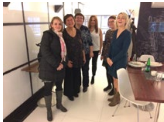
Fotografija št. 6: Nekaj delavcev SLZT in njihovih sodelavcev (od katerih so določeni predavali tudi na konferenci).

9. novembra 2016 je Družba za zdravljenje odvisnosti od tobaka (SLZT) priredila konferenco „Tobak in zdravje“.